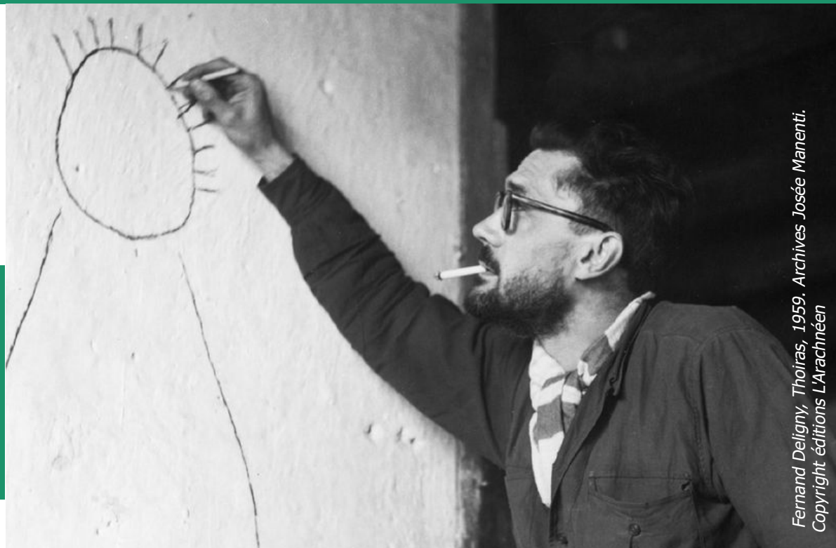
Fernand Deligny, Thoiras, 1959.

Fernand Deligny, Les vagabonds efficaces.